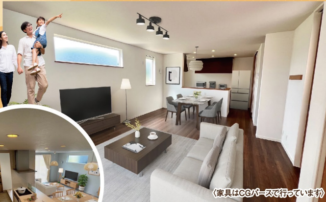
(家具はCGベースで行っています)