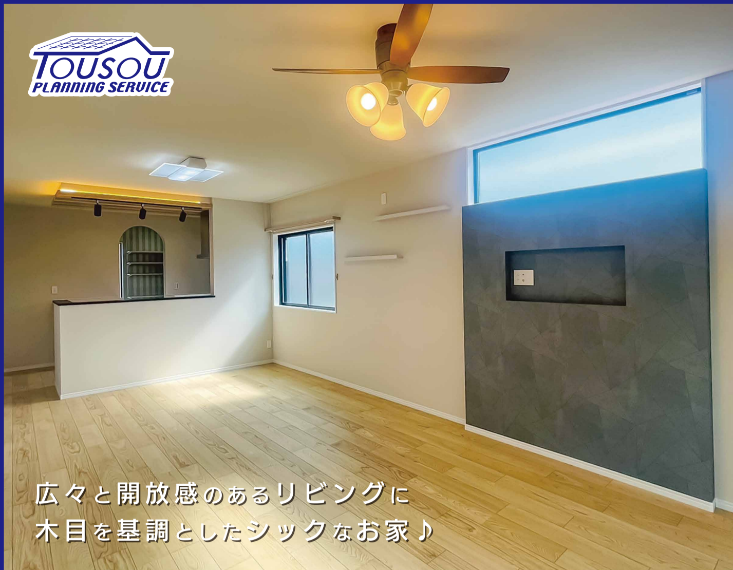
広々と開放感のあるリビングに 木目を基調としたシックなお家♪