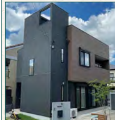
令和2年3月築の築浅物件!!