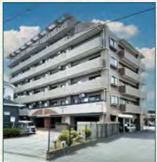
大型ルーバルバルコニー付!!