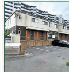
シャーマゾン物件!!