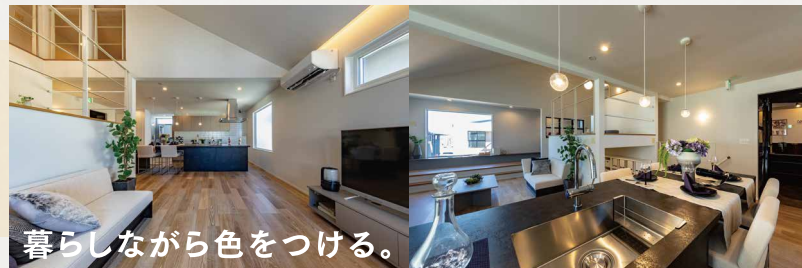
暮らしながら色をつける。