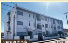
3月末退去予定 (現地写真)