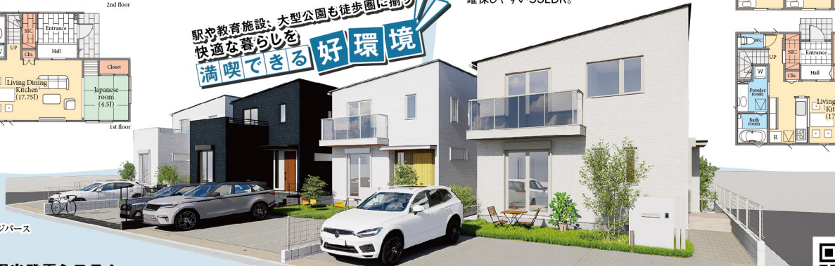
※現地完成イメージバス

—可能性を広げるリビング— リビングはライフスタイルに応じて家具配置がしやすい 整形プランを用意。 家族それぞれに個室が設けられ、プライベート空間が 確保しやすい5SLDK。