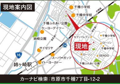
カーナビ検索：市原市千種7丁目-12-2

※分筆後の引渡しとなります。分筆により面積に誤差が生じた場合、分筆後の面積を売買対象とさせていただきます。